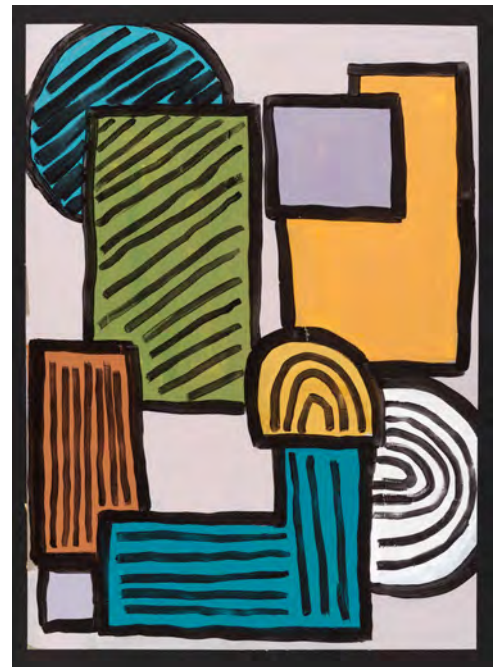
Me and the boys, 2022, 77.5 x 56cm, Acrylic on Paper