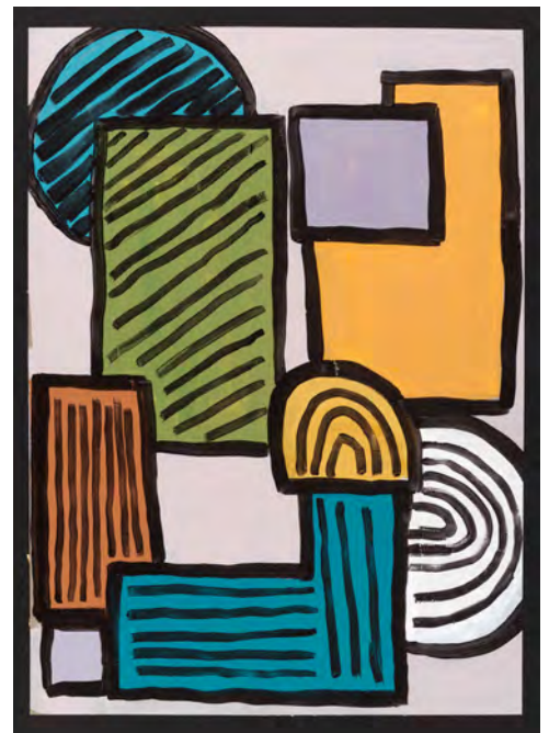
Me and the boys. 2022. 77.5 x 56cm. Acrylic on Paper