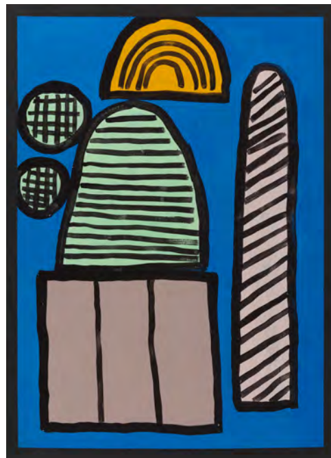
in your older, you have to respect me. 2022. 77.5 x 56cm. Acrylic on Paper