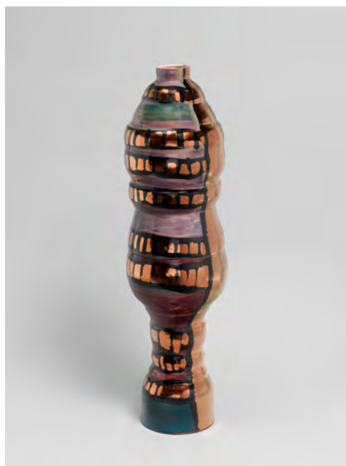
You didn't see me huggin' up with no one (From 'The Women Of Skip Avenue', 2022, 60.5 x 18 x 18 cm, Glazed Stoneware)