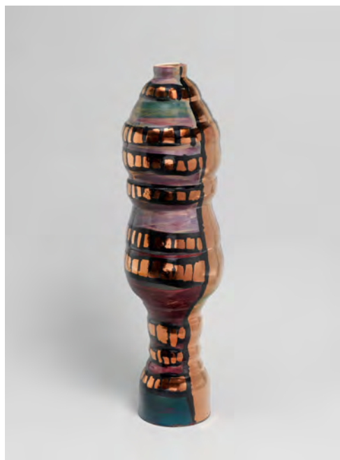
You didn't see me hugged up with no one (From 'The Women Of Skip Avenue', 2022, 60.5 x 18 x 18 cm, Glazed Stoneware)