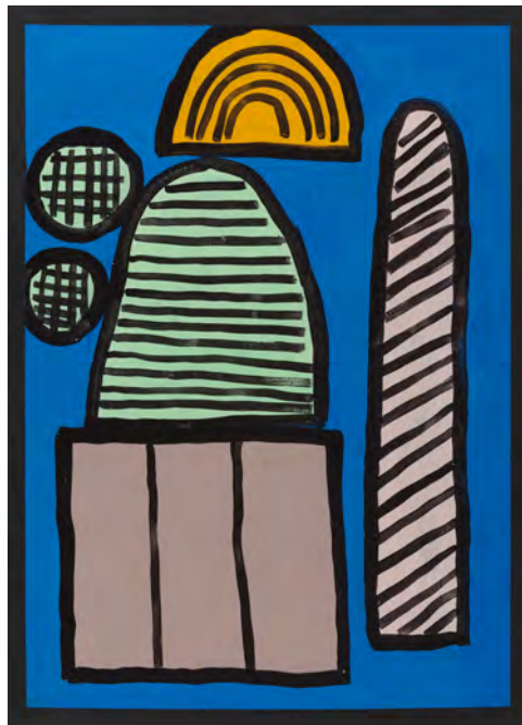
In your elbow, you have to respect me, 2022, 77.5 x 56cm, Acrylic on Paper